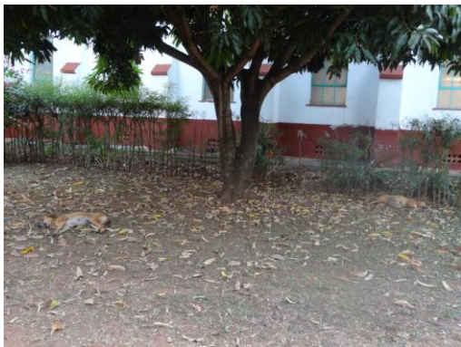
Twee wilde honden in ruste!

Doordat het terrein waarop de gebouwen zich bevinden, maar gedeeltelijk is afgeschermd met een hekwerk, is er regelmatig overlast van wilde honden en wordt er ook steeds vaker ingebroken. Zo zijn er het afgelopen jaar zakken maïs en bananentrossen gestolen.